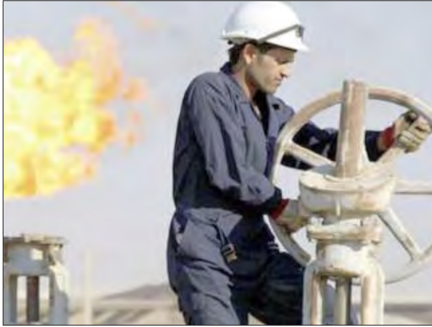
GNL et raffinage de pétrole brut : baisses de la production

Ce taux de réalisation s'explique, principalement, par des soutirages de gaz naturel supérieurs aux prévisions, notamment de Sonelgaz (taux de réalisation de 120%) et des gazoducs à l'export.