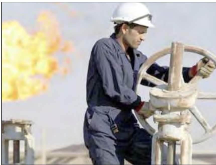
GNL et raffinage de pétrole brut : baisses de la production

Ce taux de réalisation s'explique, principalement, par des soutirages de gaz naturel supérieurs aux prévisions, notamment de Sonelgaz (taux de réalisation de 120%) et des gazoducs à l'export.